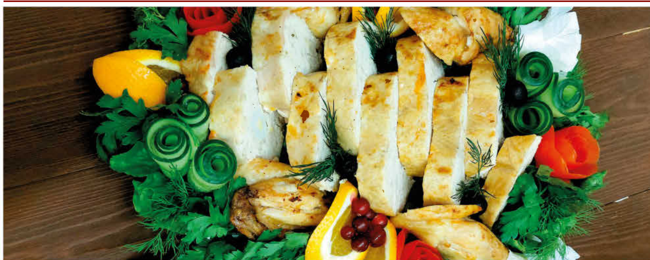
КУРИЦА, ФАРШИРОВАННАЯ ГРЕЦКИМ ОРЕХОМ