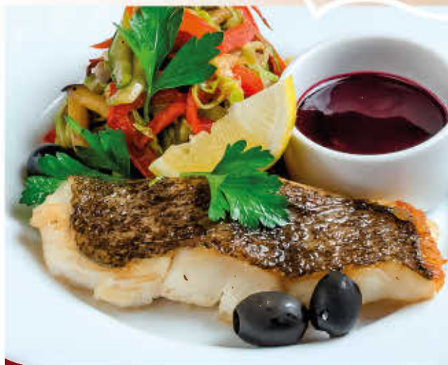
ФИЛЕ СУДАКА (с обжаренным овощным спагетти и ягодным соусом)