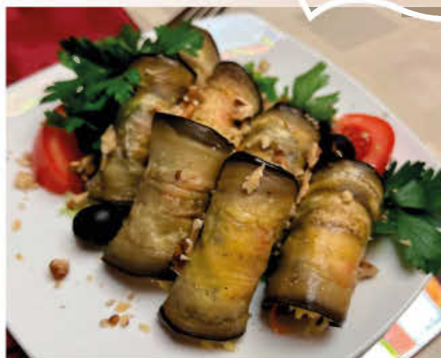
РУЛЕТКИ ИЗ БАКЛАЖАН С КОРЕЙСКОЙ МОРКОВЬЮ И СЫРОМ

(баклажаны обжаренные, соус острый, язык, орехи грецкие)