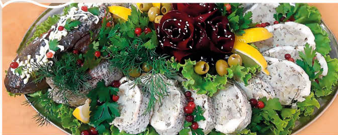
ЩУКА, ФАРШИРОВАННАЯ ГРИБАМИ СУДАК, ФАРШИРОВАННЫЙ ГРИБАМИ