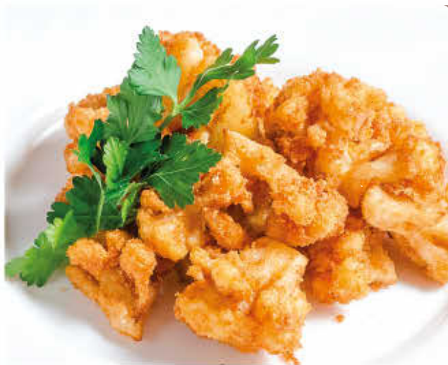
ЦВЕТНАЯ КАПУСТА, ЖАРЕННАЯ В СУХАРЯХ