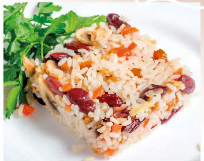
РИЗОТТО (рис, болгарский перец, фасоль, грибы)