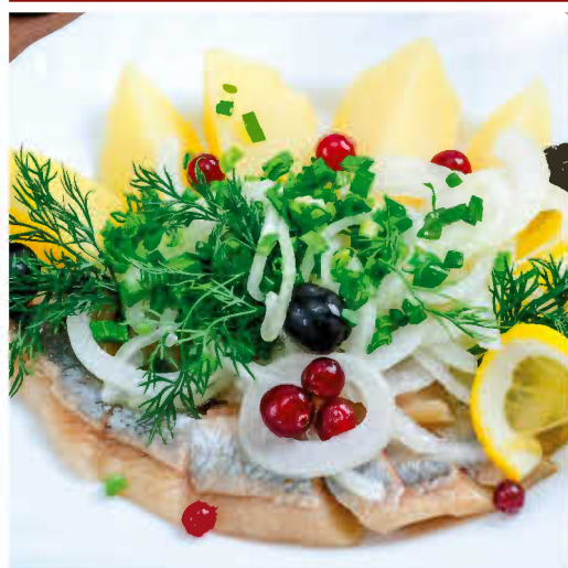
СЕЛЕДОЧКА С ГАРНИРОМ 100/100г 300р (картофель, маринованный лук, лимон, зелень, горчичная заправка)