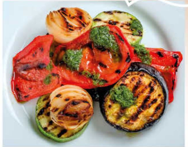
ОВОЩИ ГРИЛЬ 150г 200р (помидоры, баклажан, перец, кабачок, лук репка)