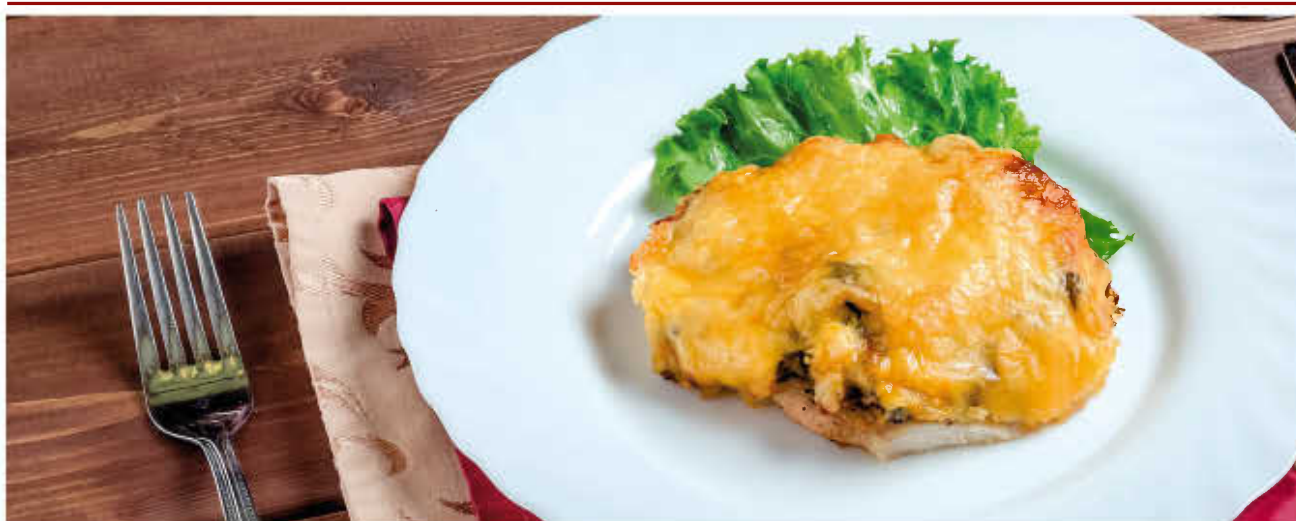
КУРИНОЕ ФИЛЕ (запеченное с грибами под сыром)