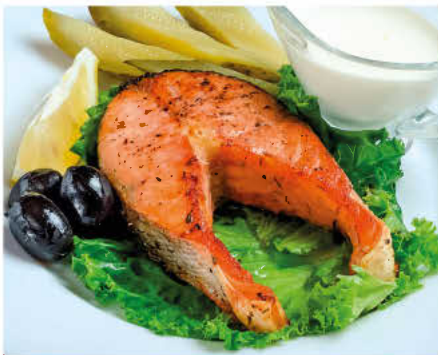
СТЕЙК ИЗ ФОРЕЛИ (с корнишонами под сливочным соусом)