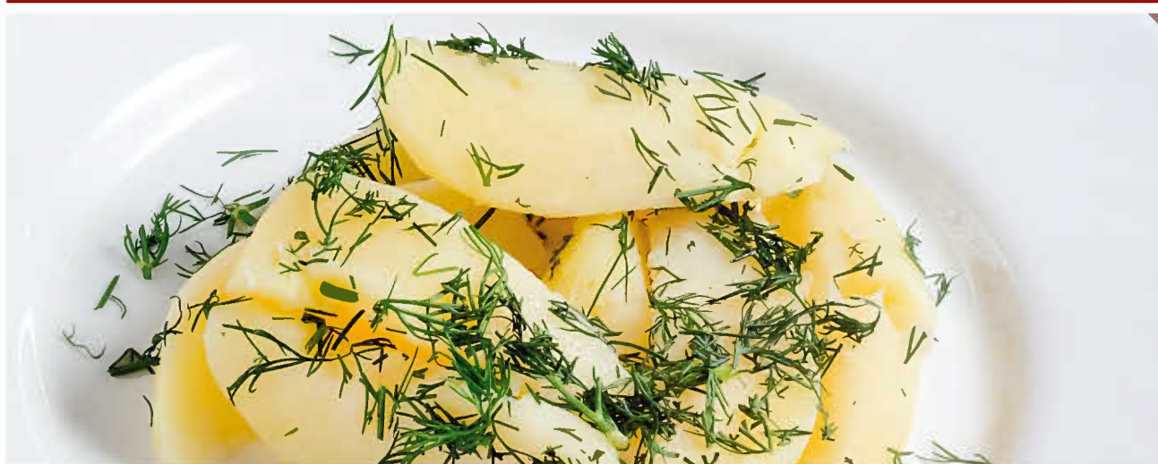
КАРТОФЕЛЬ ОТВАРНОЙ С ЗЕЛЕНЬЮ