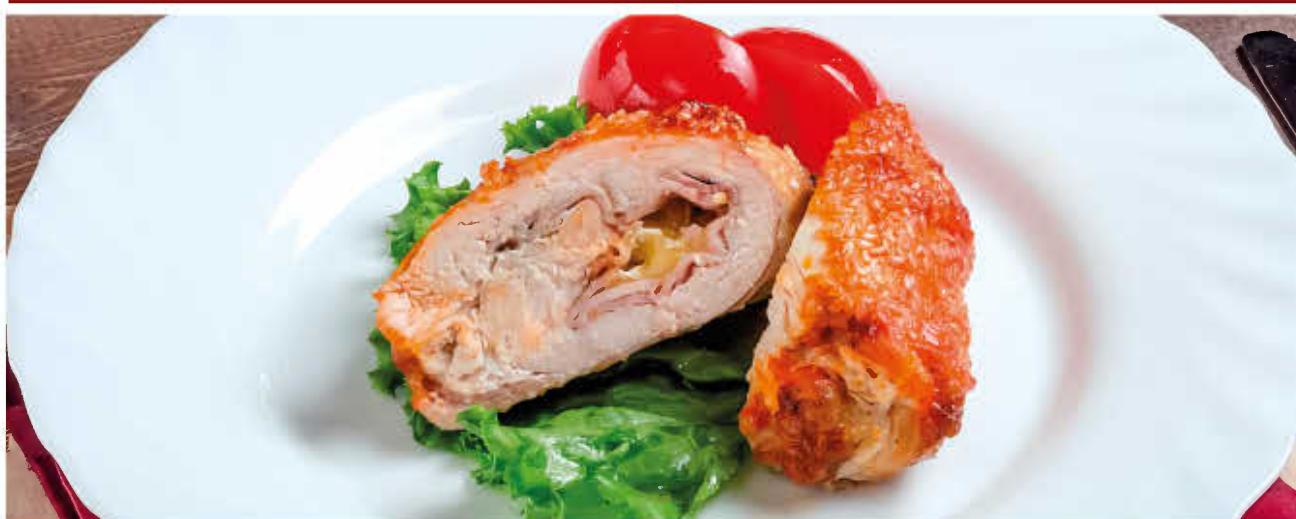
ФИЛЕ КУРИЦЫ С ОКОРОКОМ И СЫРОМ (белое мясо курицы в винном соусе, фаршированное окороком и сыром)