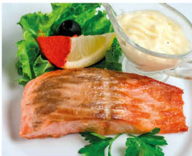
СЁМГА ПОД СЫРНЫМ СОУСОМ 100/50г 1150р