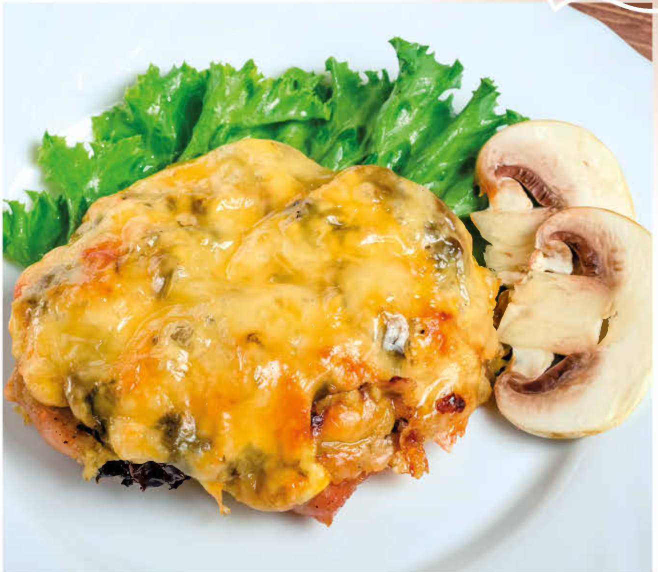
МЯСО ПО-СЛАВЯНСКИ (свинная отбивная, запеченная с грибами и луком под румяной сырной корочкой)