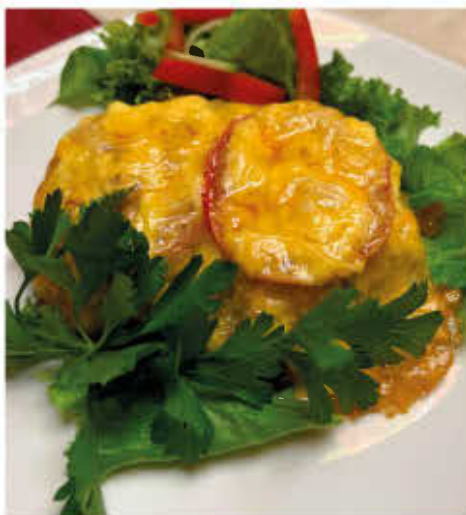
МЯСО ПО-УРАЛЬСКИ 270г 650р (свинная отбивная, запеченная с грибами с маринованными огурчиками, помидором под румяной сырной корочкой)