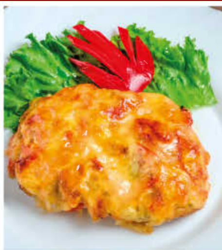
МЯСО «ПИКАНТНОЕ» 150г 550р (свиная отбивная запеченная со сладким перцем и помидором, лучком под румяной сырной корочкой с зеленью)