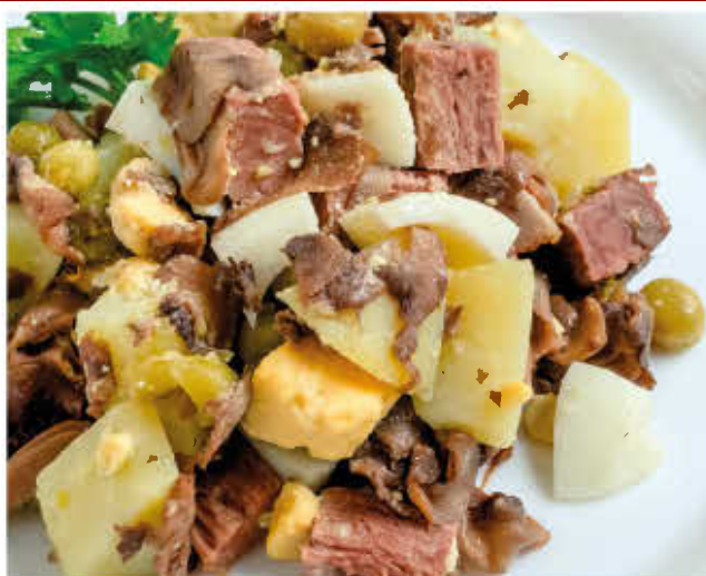
РУССКИЙ 150г 300р (говядина, грибы, маринованный огурчик, зеленый горошек, яйцо, картофель, майонез)