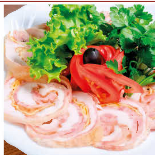
РЕЛЕТ КУРИНЫЙ (омлетный блинчик, ветчина)