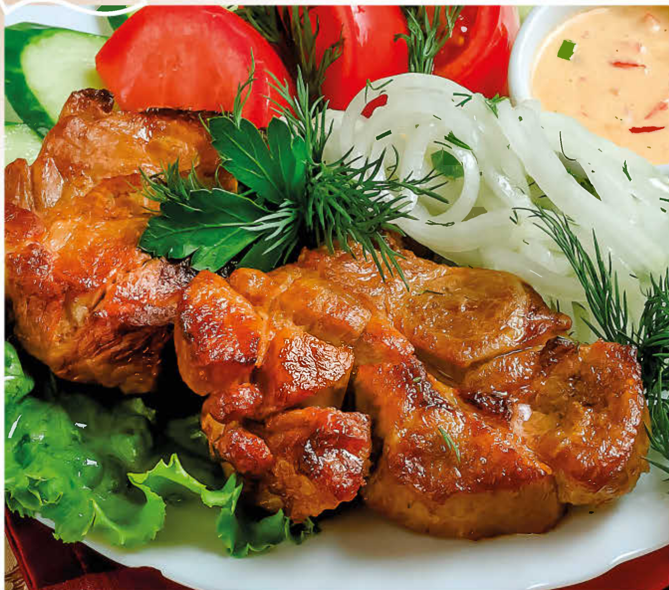
ШАШЛЫК ИЗ СВИНИНЫ (со свежими овощами, маринованным луком и шашлычным соусом)