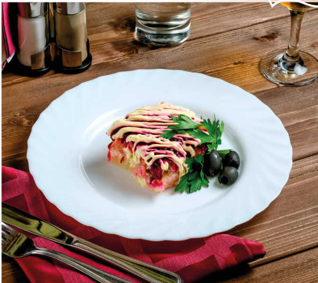
СЕМГА ПОД ШУБОЙ СЕЛЕДОЧКА ПОД ШУБОЙ