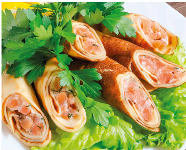
БЛИНЧИКИ С СЕМГОЙ (с лимоном и зеленью)