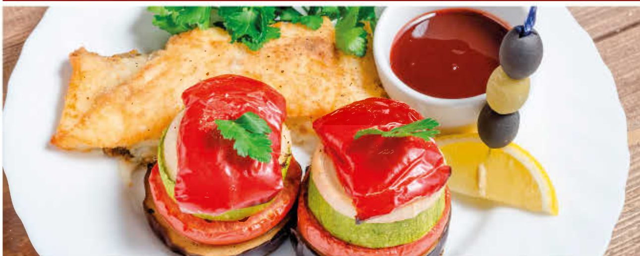
ФИЛЕ ПАЛТУСА (с овощным рататуюем и соусом «Белое вино»)