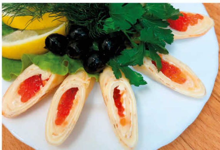
БЛИНЧИКИ С КРАСНОЙ ИКРОЙ