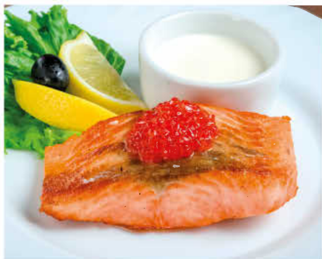
СЁМГА ПОД ИКОРНЫМ СОУСОМ 100/50г 1200р