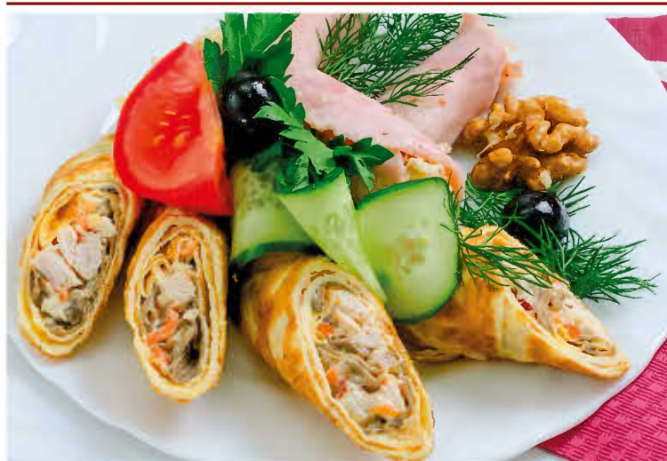
РУЛЕТКИ С КУРИЦЕЙ И ГРИБАМИ (омлетики)