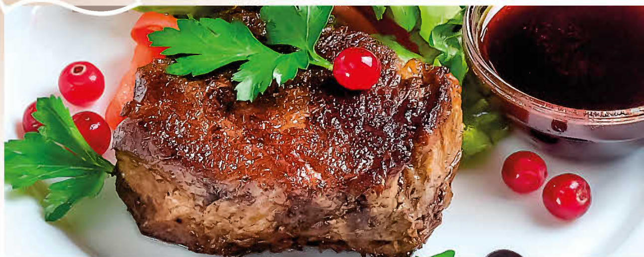
СТЕЙК ИЗ ГОВЯДИНЫ С ГРАНАТОВЫМ СОУСОМ (стейк из говяжьей вырезки с ягодой граната и зеленью)