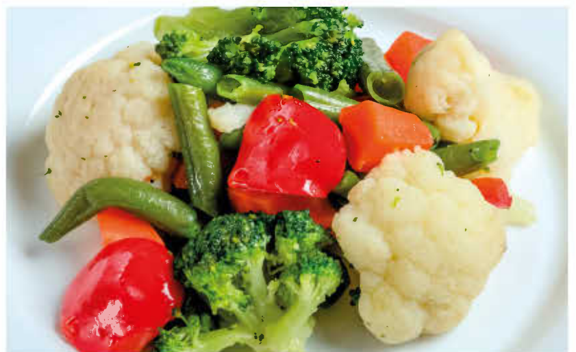
ОВОЩИ НА ПАРУ 150г 150р (цветная капуста, брокколи, брюссельская капуста, морковь)