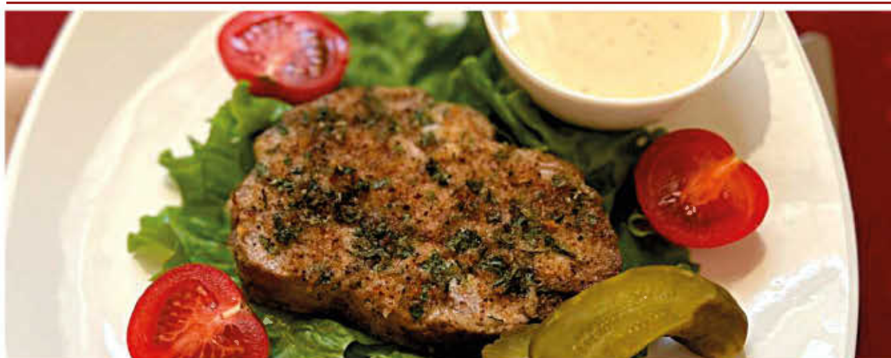
СВИНАЯ ШЕЯ С ГОРЧИЧНЫМ СОУСОМ