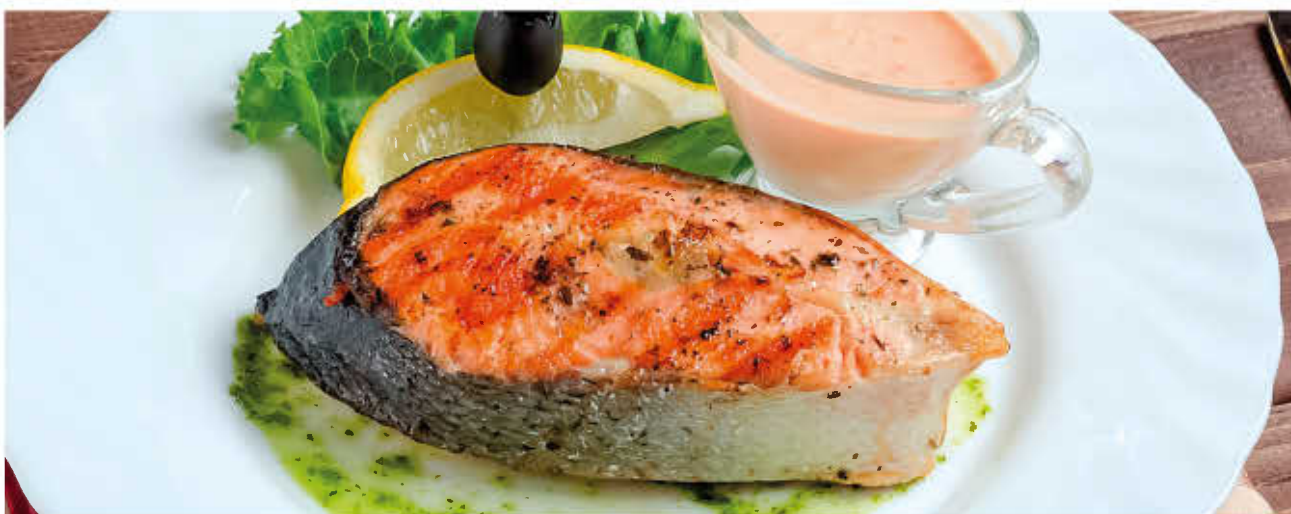
ФОРЕЛЬ ГРИЛЬ (с соусом из паприки)