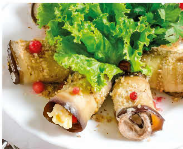
РУЛЕТКИ ИЗ БАКЛАЖАНОВ С ЯЗЫКОМ