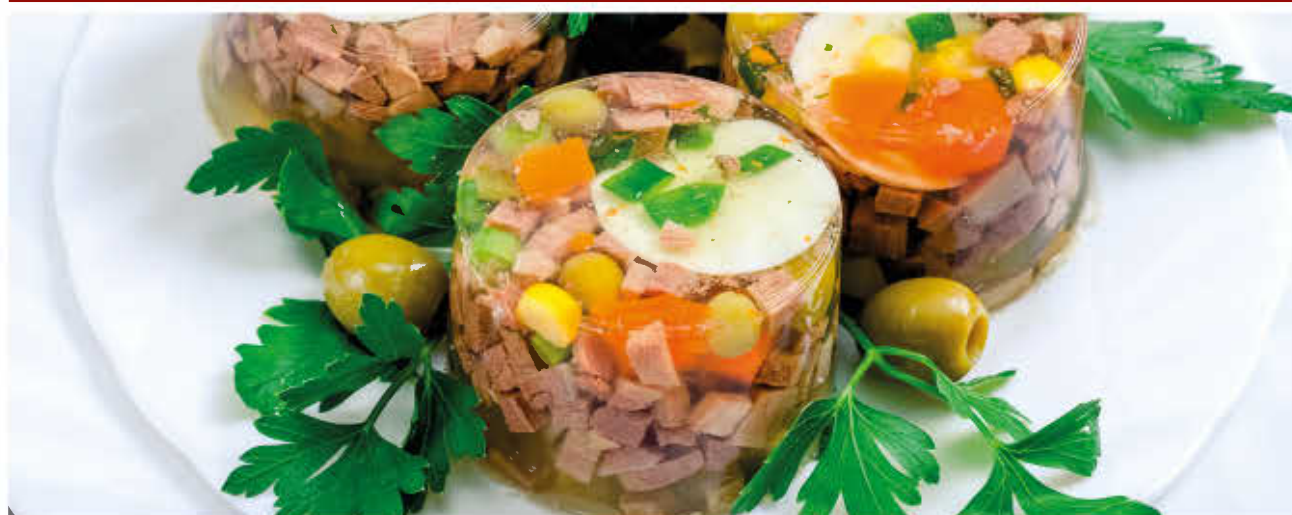
ЗАЛИВНОЕ МЯСО, ЯЗЫК