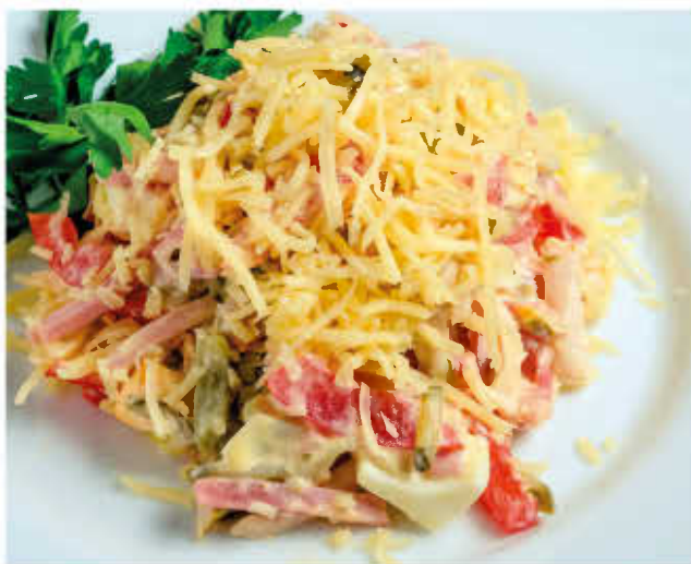
21 ВЕК 150г 250р (грудка куриная копченая, маринованный огурчик, помидор, ветчина, яйцо, сыр, майонез)