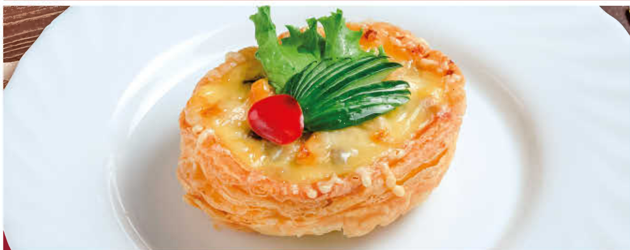
ЖУЛЬЕН С КУРИЦЕЙ И ГРИБАМИ (подается в слоеном тесте) ЖУЛЬЕН С ЯЗЫКОМ И ГРИБАМИ (подается в слоеном тесте)