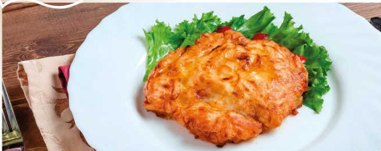
ЦЕСАРКА (филе молодой курочки в сырном кляре)