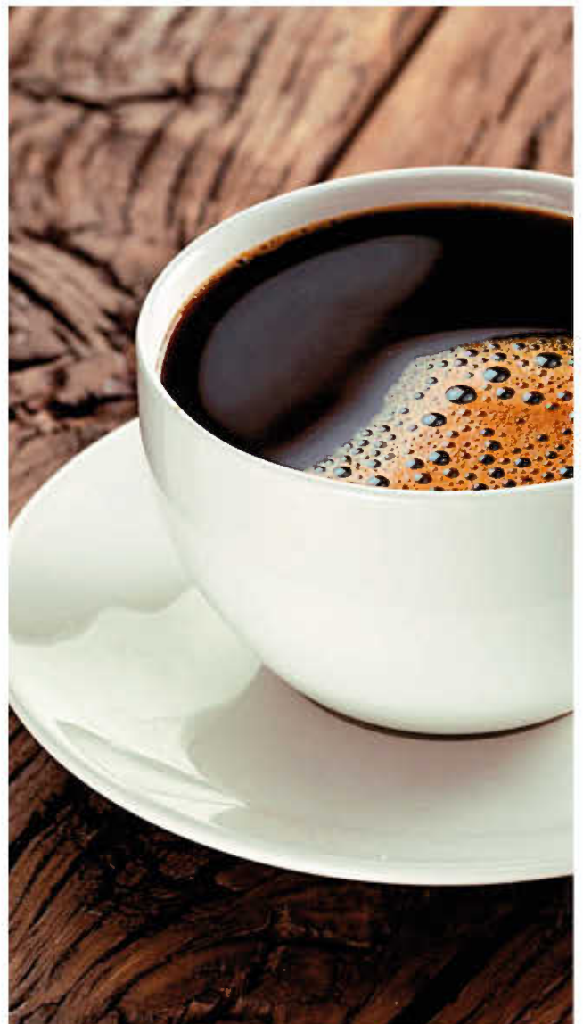
КОФЕ РАСТВОРИМЫЙ 0,2л 50р КОФЕ АМЕРИКАНО 0,15л 100р КОФЕ КАПУЧИНО 0,15л 180р