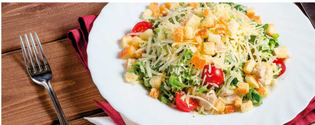
ЦЕЗАРЬ С КУРИЦЕЙ 150г 300р (филе куриной грудки обжаренное, лист салата, помидор, сыр пармезан, соус цезарь, сухарики)