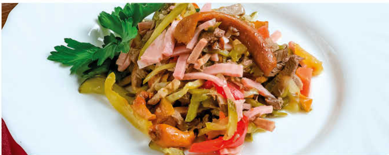
ПАТРИОТ (говядина, язык, ветчина, маринованный перец, огурец, грибы, заправка по желанию гостя)