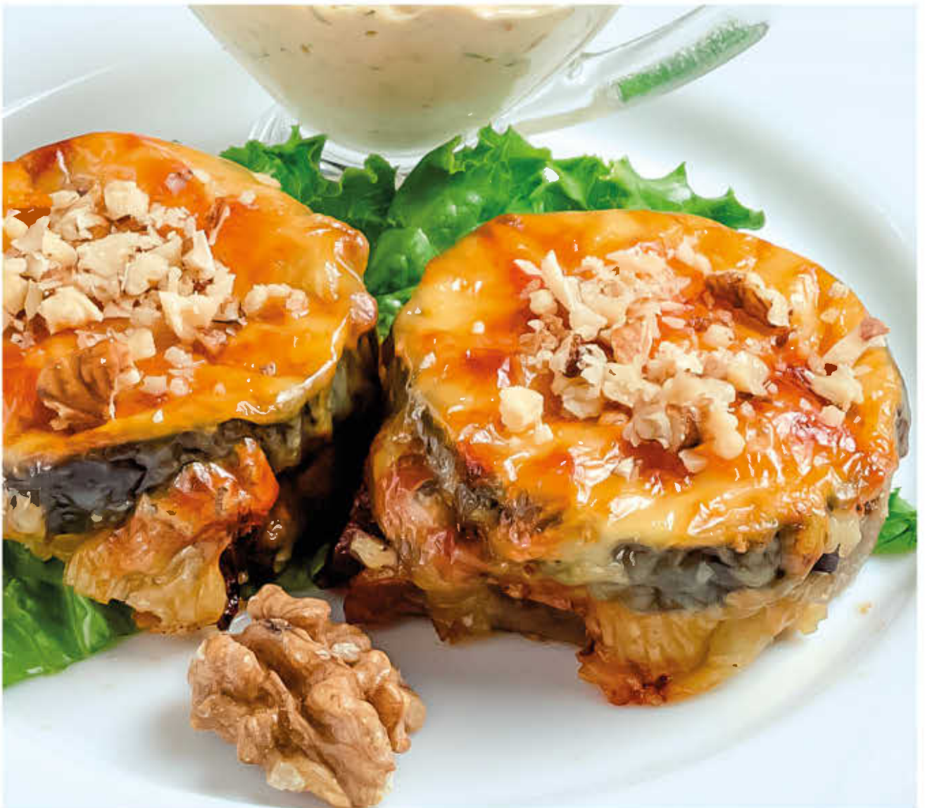
ОСТРЫЕ ЯЗЫЧКИ (с чесночно-ореховым соусом, баклажаном и зеленью)