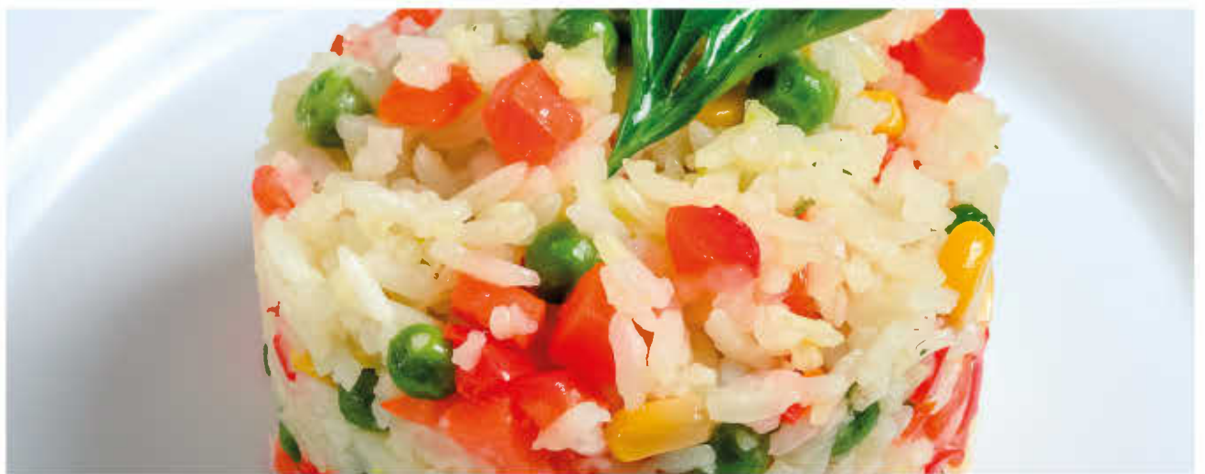
СОТЕ РИСОВОЕ (рис с овощами)