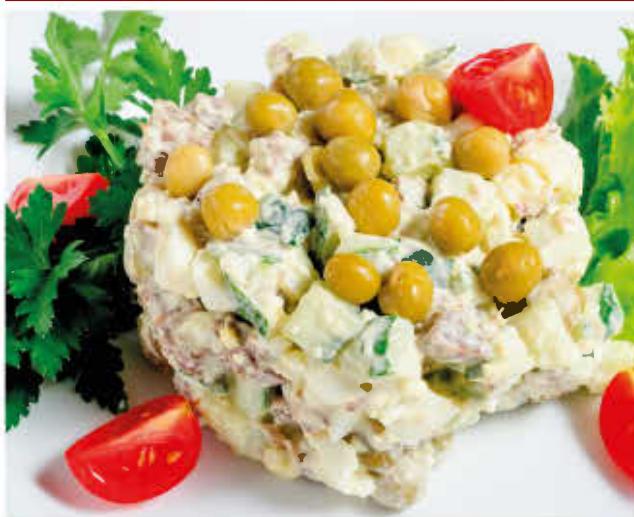
ОЛИВЬЕ С МЯСОМ 150г 300р (говядина, свежий огурчик, зеленый горошек, яйцо, лук маринованный, майонез)