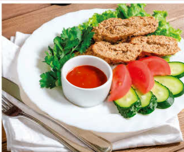
ЛЮЛЯ-КЕБАБ ИЗ ГОВЯДИНЫ (со свежими овощами, маринованным луком и соусом «от Николаевича»)