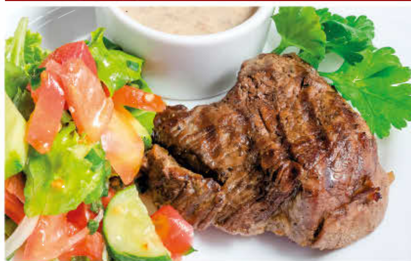
БИФСТЕКС С БЕЛЫМИ ГРИБАМИ (обжаренная говяжья вырезка с соусом из белых грибов и зелени)