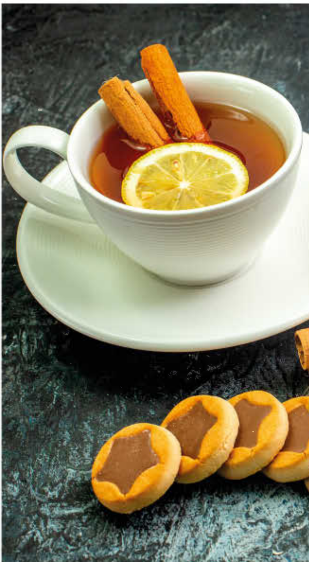
ЧАЙ ПАКЕТИРОВАННЫЙ 0,2л 50р Черный / зеленый ЧАЙ ЗАВАРНОЙ В АССОРТИМЕНТЕ 0,4л 120р (в чайничке)