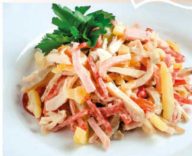
МУЖСКОЙ КАПРИЗ 150г 250р (колбаса п/к, ветчина, курица, язык говяжий, маринованный перчик, картофель, грибы, майонез)