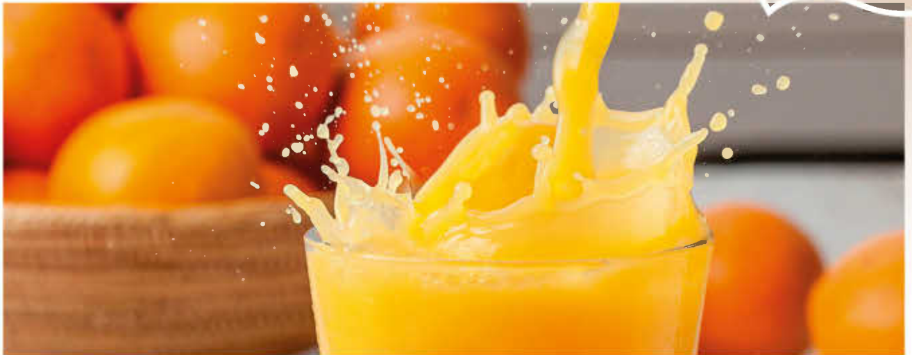
СОК В АССОРТИМЕНТЕ (апельсин, яблоко, мультифрукт, персик, томат)