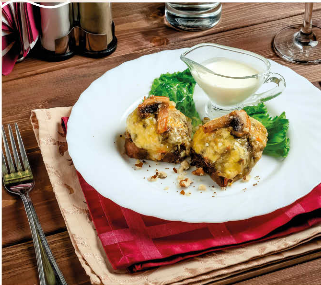
ЯЗЫК ОБЖАРЕННЫЙ С ГРИБАМИ (под сливочно-сметанным соусом)