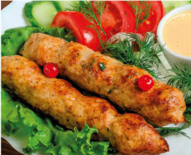
ЛЮЛЯ-КЕБАБ ИЗ КУРИЦЫ 200/100/50г 700р (со свежими овощами, маринованным луком и соусом «Острый»)