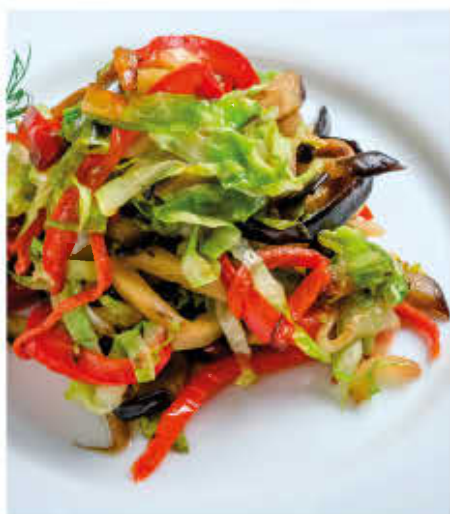
СПАГЕТТИ ИЗ ОВОЩЕЙ 150г 150р (капуста свежая, морковь, баклажаны, лук репка, болгарский перец)