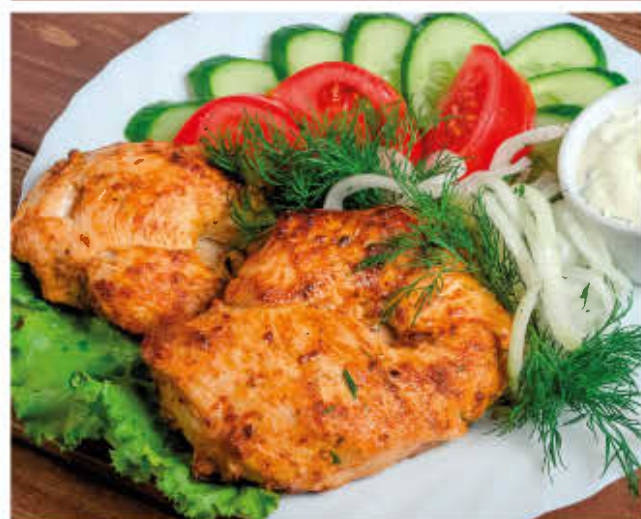
ШАШЛЫК ИЗ КУРИЦЫ (со свежими овощами, маринованным луком и соусом «Острый»)