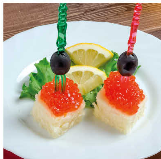
КАНАПЕ С КРАСНОЙ ИКРОЙ