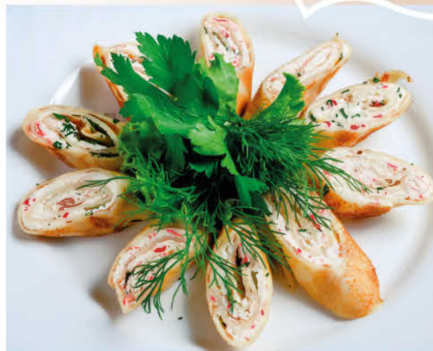
БЛИНЧИКИ С КРАБОВЫМ МЯСОМ (лист салата, лимон, сыр творожный)