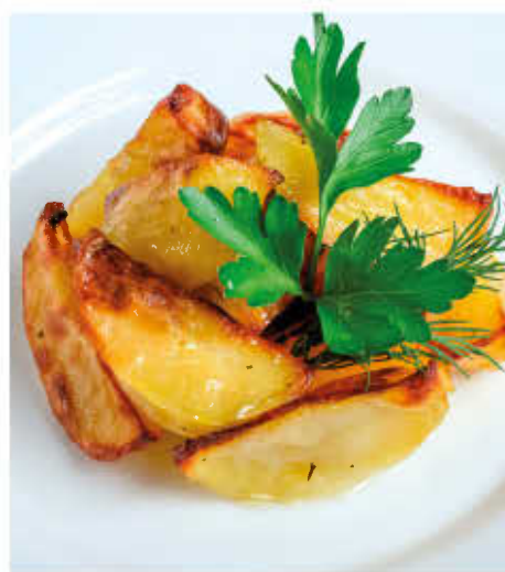
КАРТОФЕЛЬ, ЗАПЕЧЕННЫЙ ДОЛЬКАМИ