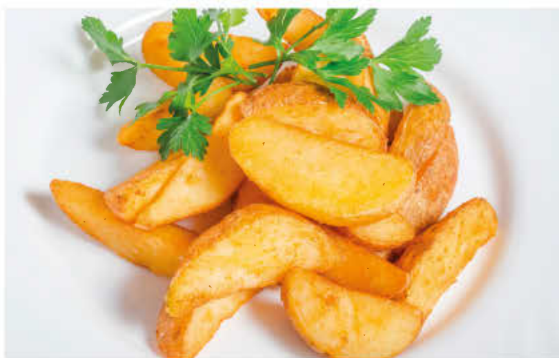
ПРЯНЫЕ КАРТОФЕЛЬНЫЕ ДОЛЬКИ