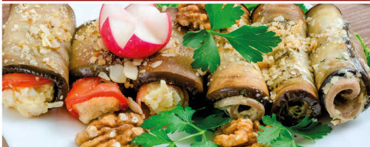
РУЛЕТКИ ИЗ БАКЛАЖАНОВ С ОВОЩАМИ

(баклажаны обжаренные, морковь, сыр, грецкие орехи)