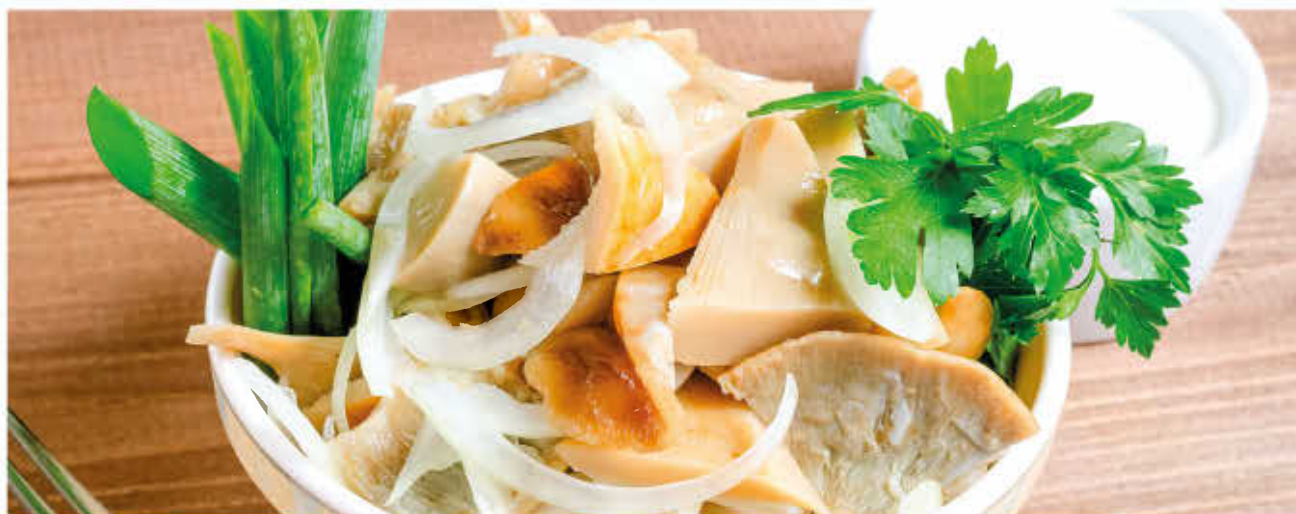
ГРУЗДИ С МАРИНОВАННЫМ ЛУКОМ И СМЕТАНОЙ

(баклажаны обжаренные, помидор, сыр, чеснок, орехи грецкие)