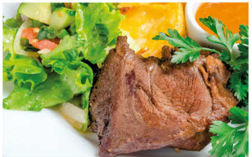
БАРАНИНА ПОД ОСТРЫМ СОУСОМ (подается с дольками жареного картофеля и зеленью)