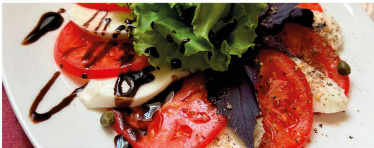
ЗАКУСКА "КАПРЕЗЕ" С БАЛЬЗАМИЧЕСКИМ СОУСОМ (помидоры, мягкий сыр Моцарелло, пряности)