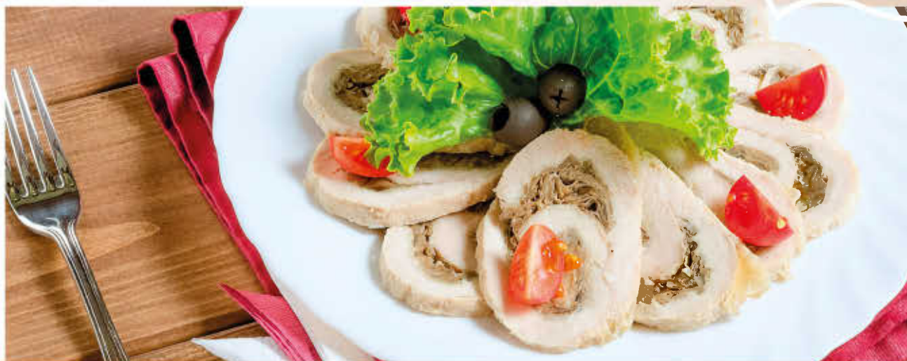
РУЛЕТ МЯСНОЙ С ГРИБАМИ