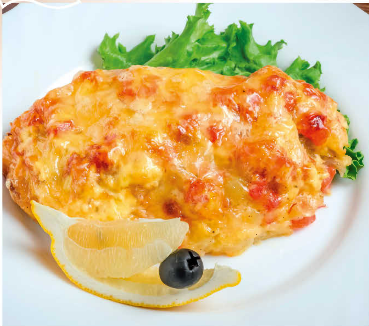
ФИЛЕ ОКУНЯ (с овощами под сыром)