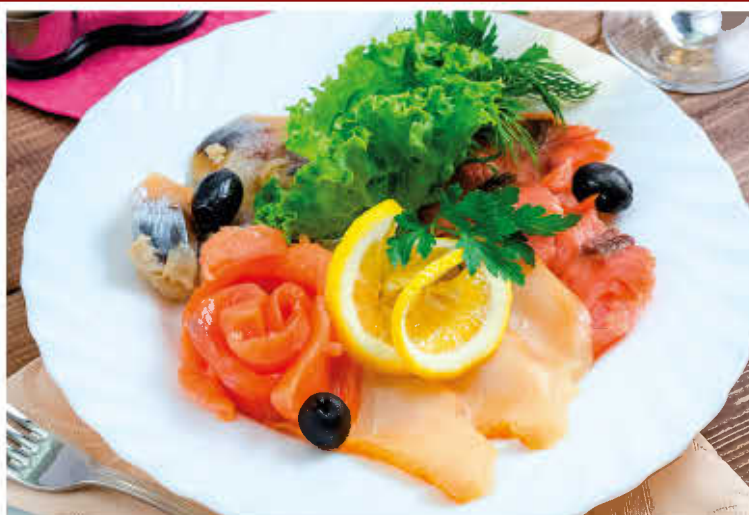
РЫБНОЕ АССОРТИ 200/30г 1000р (лосось с/с, форель с/с, кета ж/к, осетровый балык, скумбрия с/с, маслины, лимон, зелень)